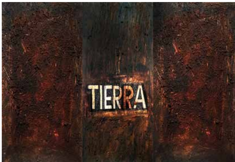
Anónimo, Tierra. 2020