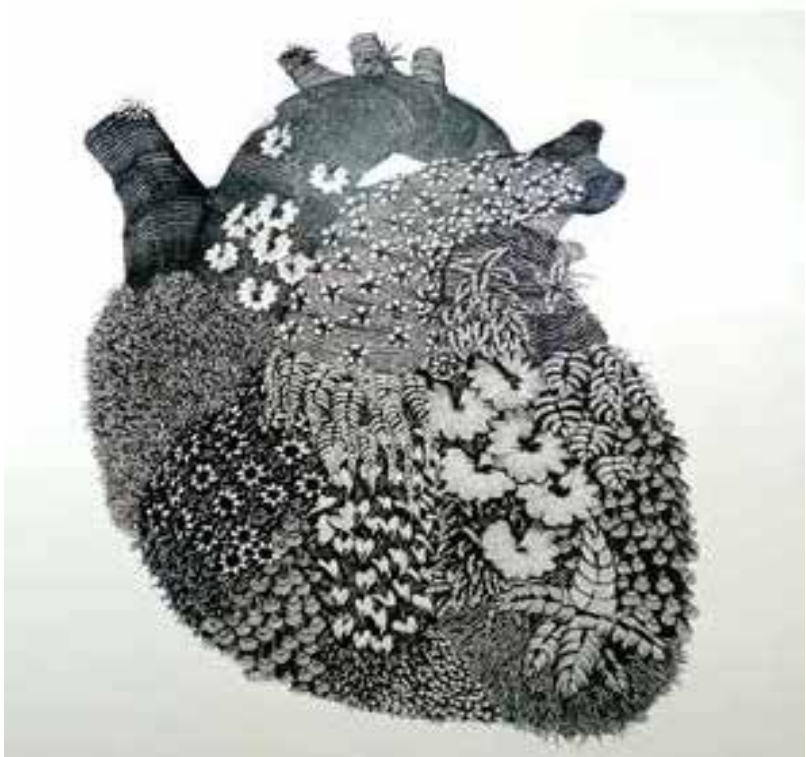
Felipe Keta Dibujo