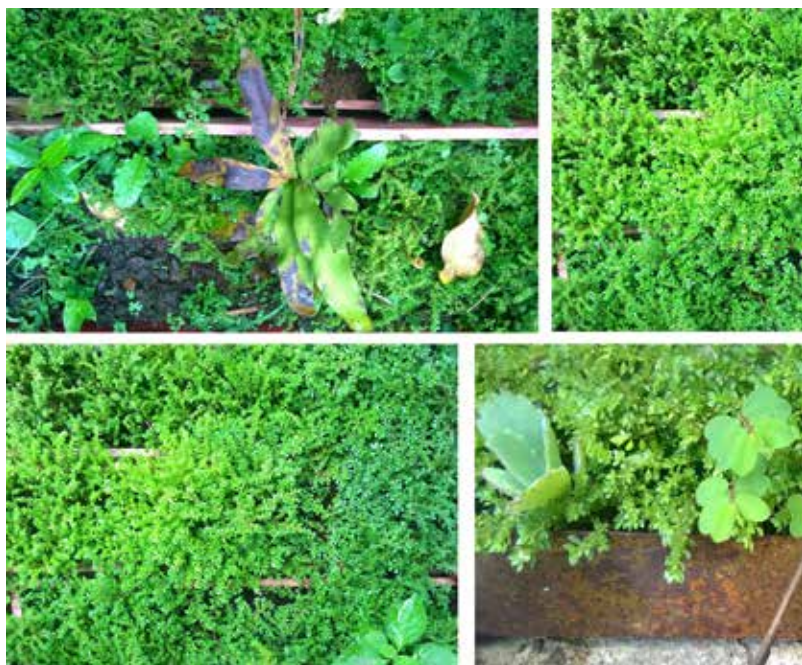
Anónimo. Jardín de Pobre 2016.

Los desyerban pues son en sí la misma hierba, el mismo No-Jardín aunque no los riegan pues si hay sol o lluvia, estos siempre estarán afrontando el trajinar cotidiano o contingencias del existir.