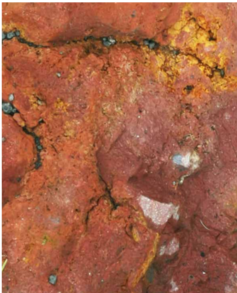
Anónimo, Tierra. 2020