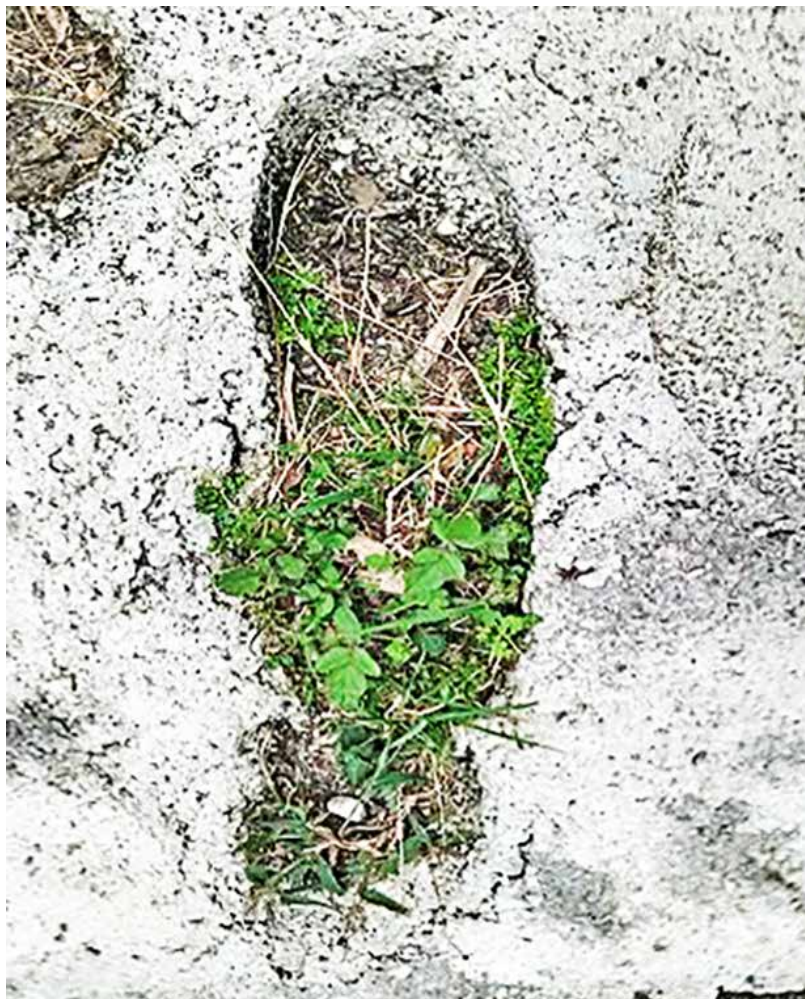
Anónimo. Huella-jardín. 2023.