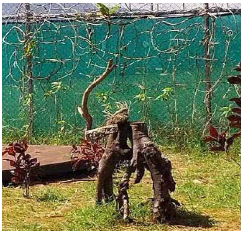
Moyo Coyaxi. Parquesito de Rolando. 2022.