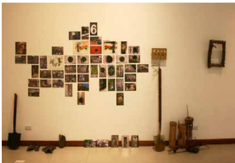
Árbol, Tierra, Raíces. Galería Nacional. 2016