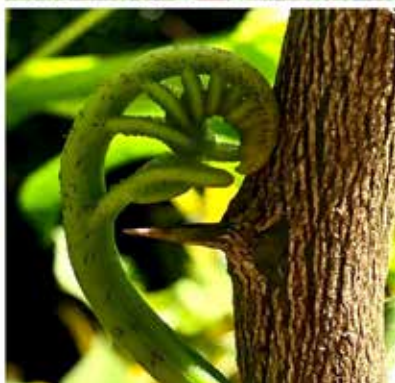
Silvia Fournier- Nudos. 2021