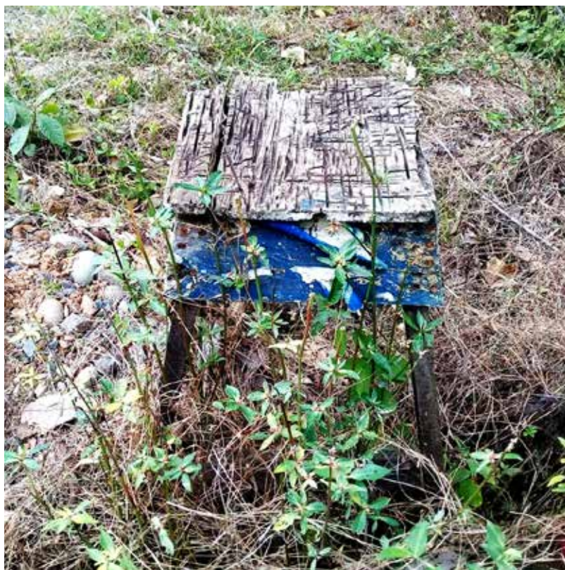
RFicardo Ávila. Jardín de pobre.. 2021