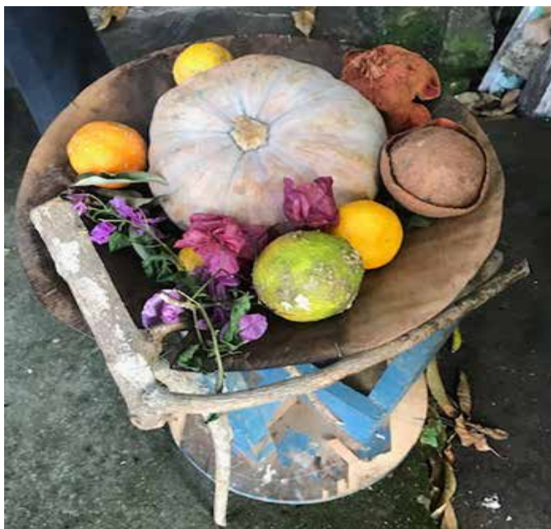
Moyo Coyaxi- En el jardín 2020.