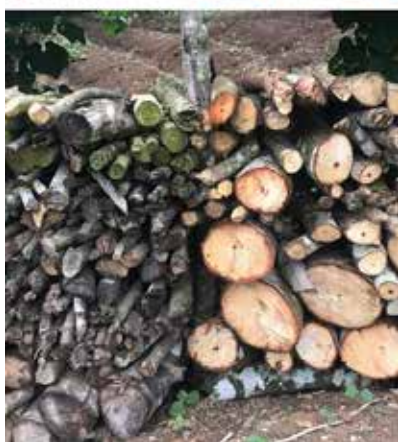
Anónimo. Jardín 2020