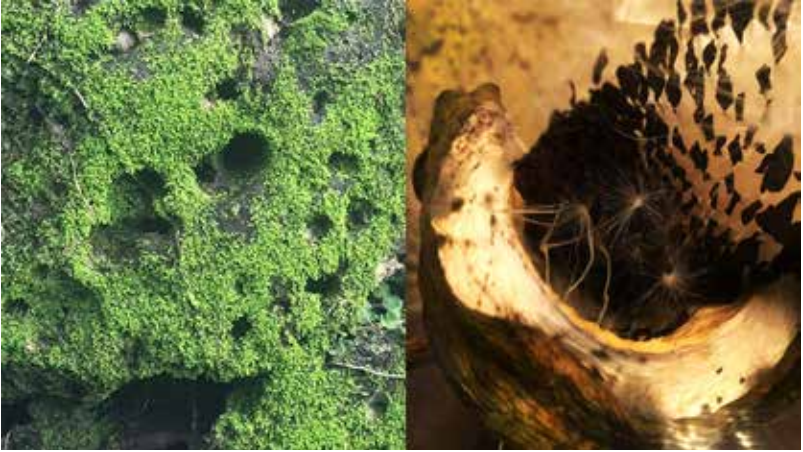
Dinorah Carballo. 2020