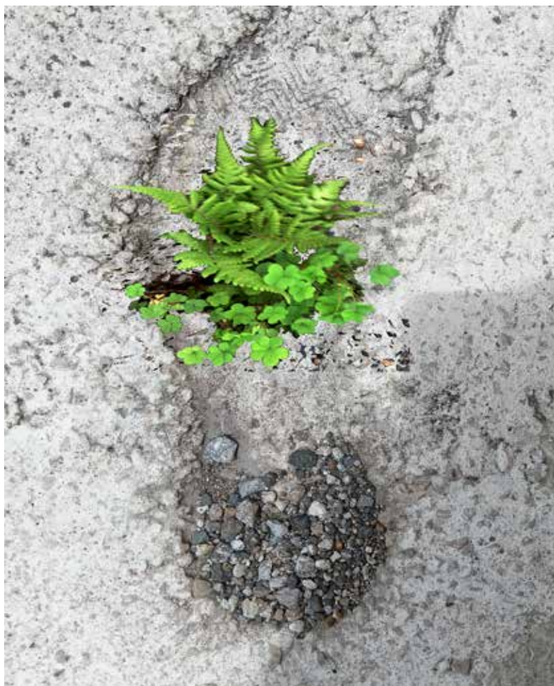
Anónimo. Huella-jardín. 2023.